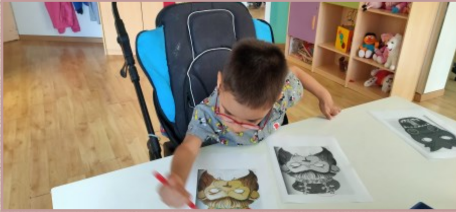
M'ha agradat molt pintar la màscara del Lleó.